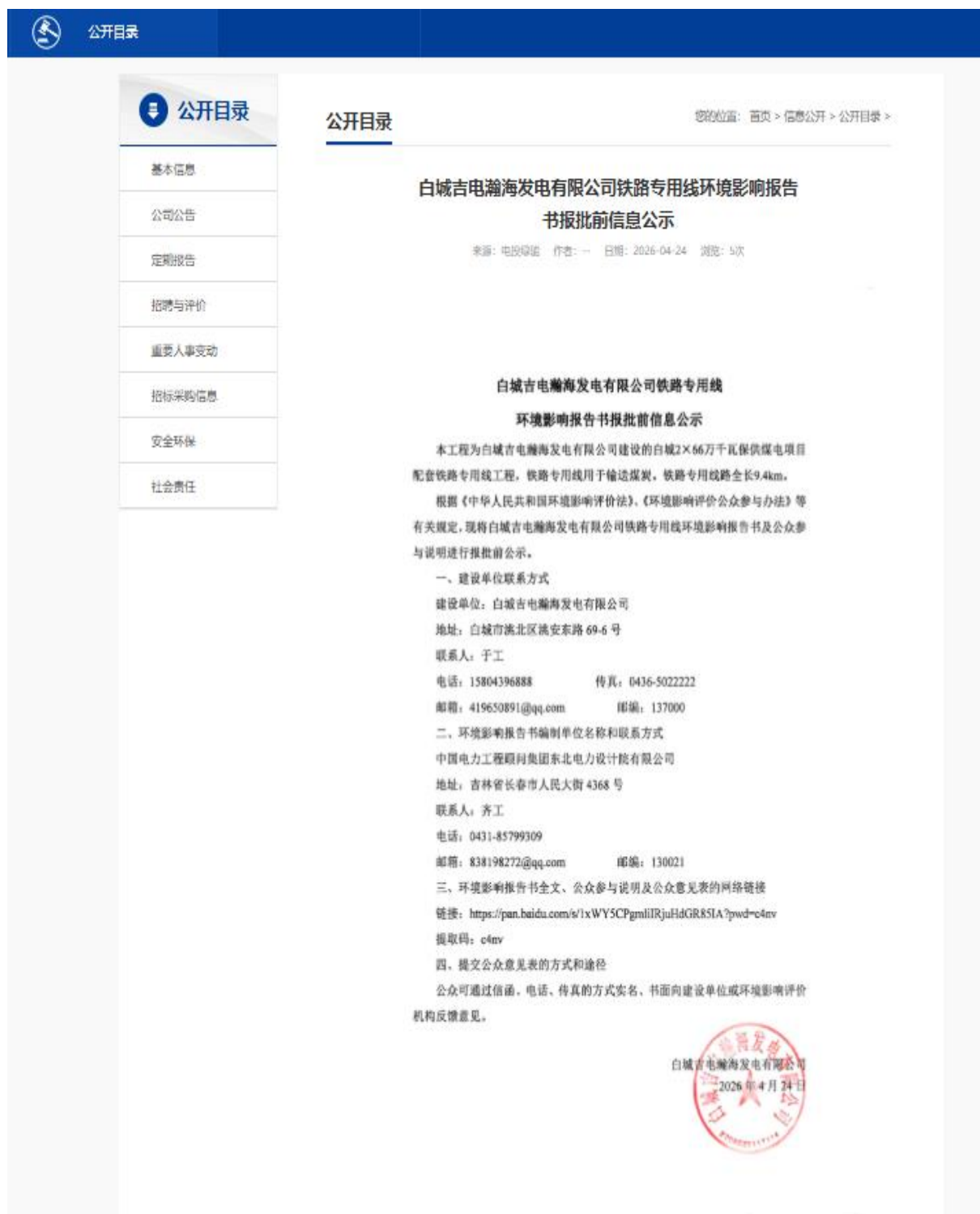
图6 本项目环境影响评价报告书报批前公示截图(网络)