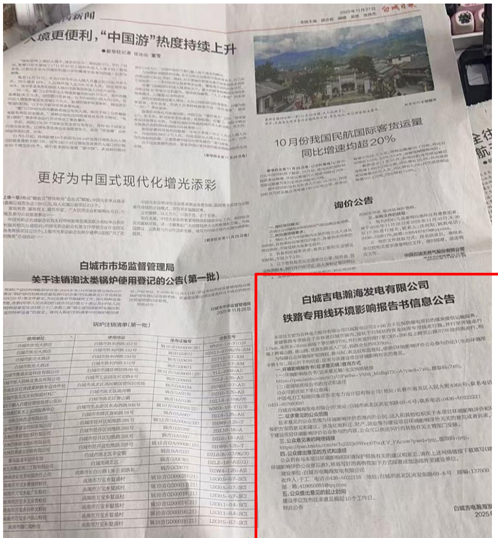
图4 《白城日报》截图(2025年11月27日)